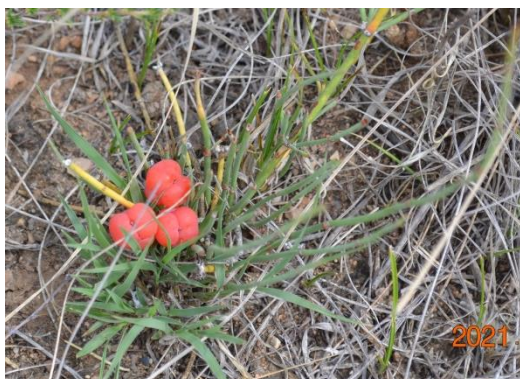
Зураг 32. Ephedra monosperma G. G. Gmel. Ex C. A. Mey.