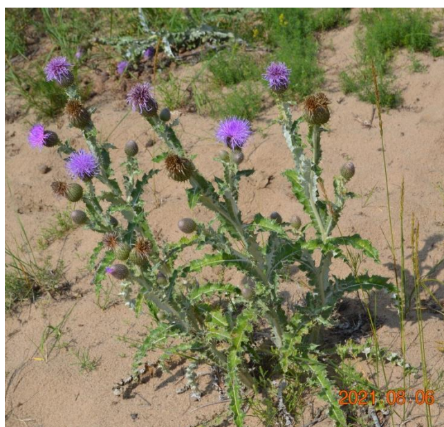
Зураг 36. Olgaea leucophylla (Turch.) Pjin.