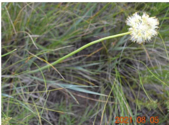
Зураг 40. Allium condensatum Turcz.