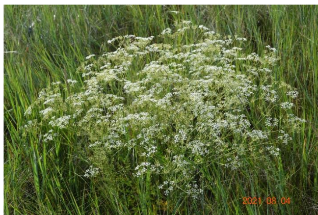
Зураг 34. Saposhnikovia divaricata (Turcz.) Schischk.