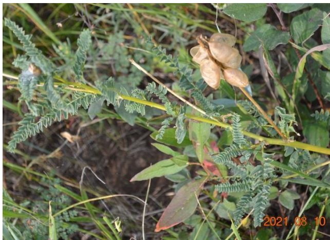
Зураг 43. Astragalus mongolicus Bge.