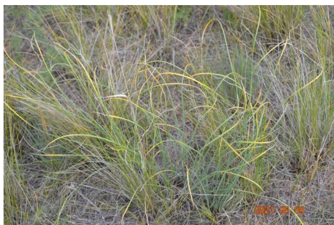
Зураг 38. Iris tenuifolia Pall.