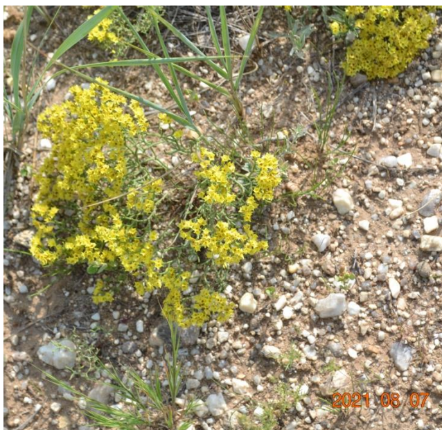
Зураг 39. Limonium aureum (L.) Hill ex Ktze.

Биологийн онцлог: 5-20 см өндөр ургадаг, сууриасаа их салаалсан, тахиралдсан, дэвсмэл иштэй, суурьтаа навчны бараан хүрэн үлдэгдлээр хучигдсан, үндэсний холтос хар хүрэн, цэцэг хурц алтлаг шар. Амьдралын хэлбэр: Олон наст өвслөг ургамал. Монгол дахь тархалт: Ховд., Дунд. Халх., Дорн.-Монг., Их н., Олон н., Дорн. говь., Говь-Алт., Алт. -өвөр., Алаш.. Ургах орчин: Цөлөрхөг хээрийн үйрмэг чулуут хажуу, бэл хормой, марзлаг цөл, голын эргийн хужир,