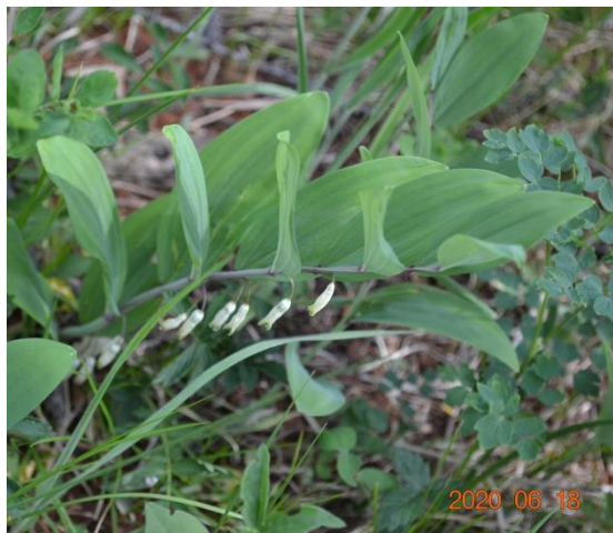
Зураг 42. Polygonatum odoratum (Mill.) Druce.