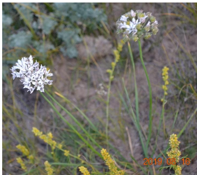
Зураг 41. Allium odorum L.-Анхил сонгино