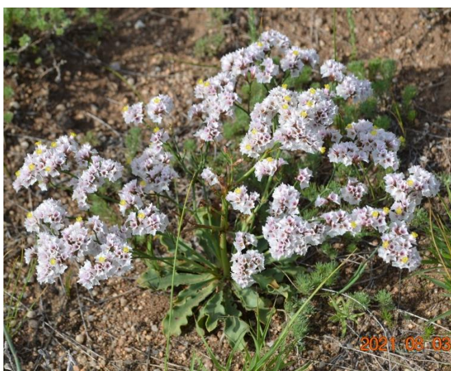
Зураг 35. Limonium bicolor (Vge.) Kuntze.